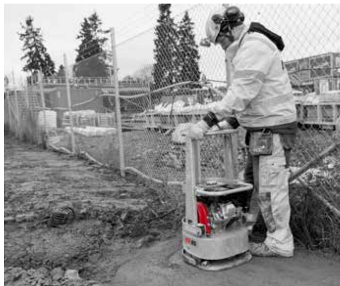
Packningsdjup för markvibratorer efter minst 6 överfarter

Vid packning av asfalt finns maskiner med inbyggd vattentank och sprinkler, som kyler/ smörjer bottenplattan för att förhindra att varm asfalt fastnar. Bottenplattorna på dessa maskiner är utformade för att förhindra spårbildning vid asfaltarbetet.