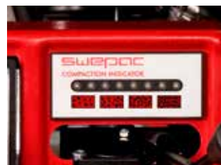
Kompakteringsindikator - tillval

Svepac Kompakteringsindikator ger en snabb och tydlig indikation om packningsgraden. Passar till FB 430-FB 510.